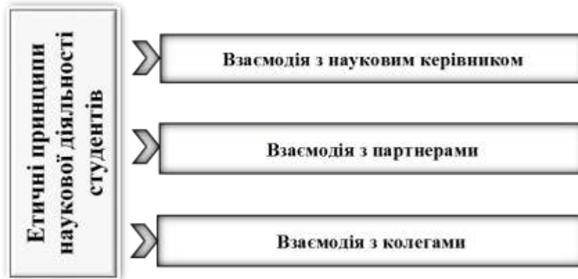
Рис. 3 – Етичні принципи наукової діяльності студентів

Практичне використання етичних принципів у науковій діяльності студентів Етика наукової діяльності – це правила поведінки, які мають неухильно дотримуватись усі науковці, зокрема, і молоді дослідники, студенти (рис. 3).